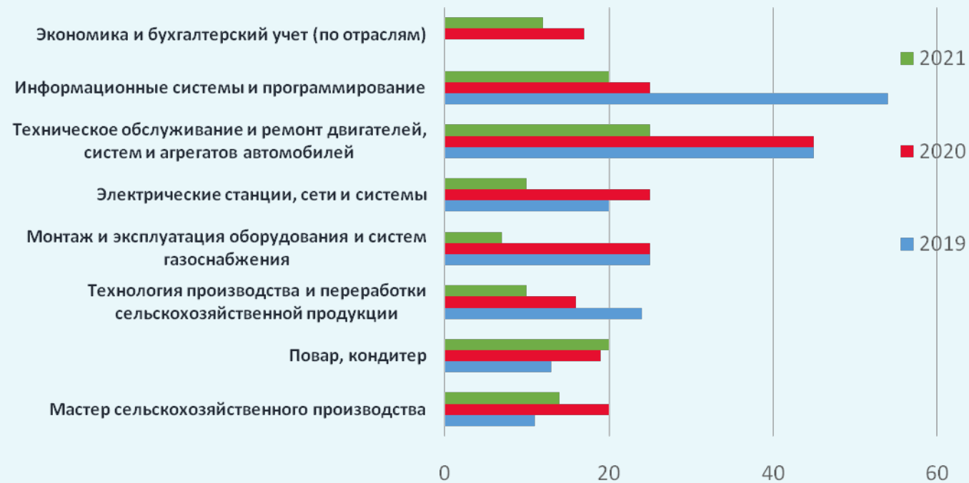
Показатели приёма на специальность, чел.